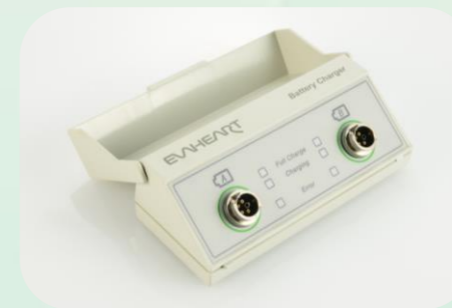
持ち運びが便利な充電器

また、EVAHEART®システムの重要な機構であるクールシールシステムは、クールシール液を血液ポンプとコントローラの間を循環させ、血液ポンプのシール部を冷却するとともに、シール部よりごくわずかに拡散してくる血漿タンパク成分を洗浄・除去します。また、滑り軸受の潤滑を併せて行います。