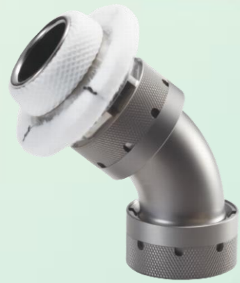
ダブルカップチップレス (DCT) カニューレ