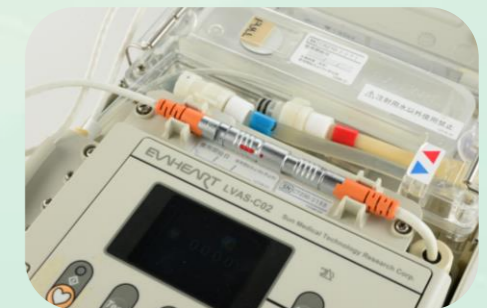
安心の非常用バッテリー搭載