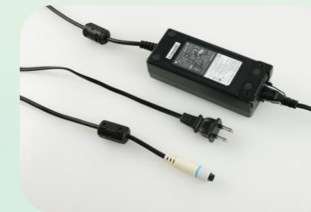
2ピンプラグを採用した AC/DCアダプタ