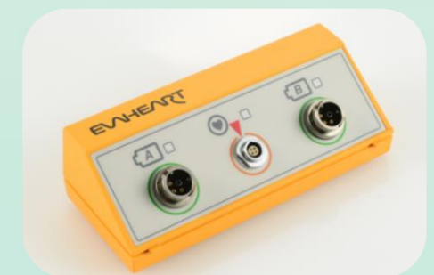
小さく軽い バックアップコントローラ