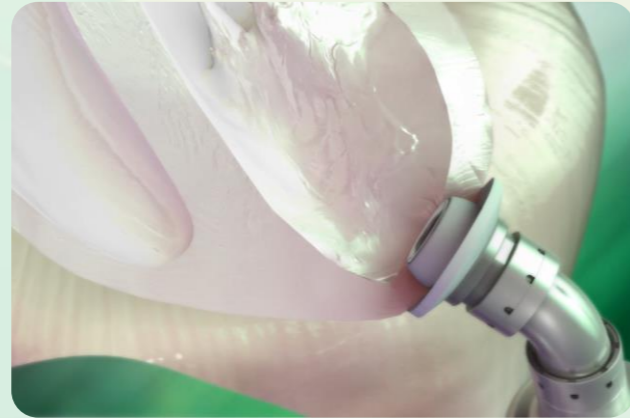
心臓への装着イメージ

心室内への突出をなくした新しいインフローカニューレ (DCTカニューレ) を導入することにより、カニューレの位置異常やWedge thrombusの形成が低減されることを期待しています。