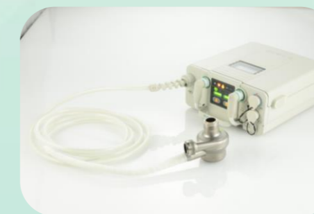
ゆとりある長さ (3m) の ポンプケーブル