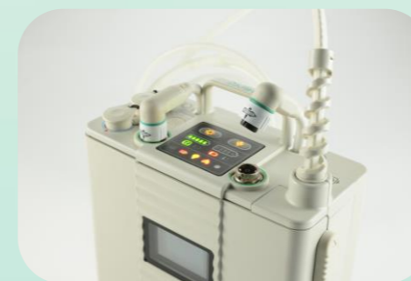
簡単に抜け落ちない リリースグリップ